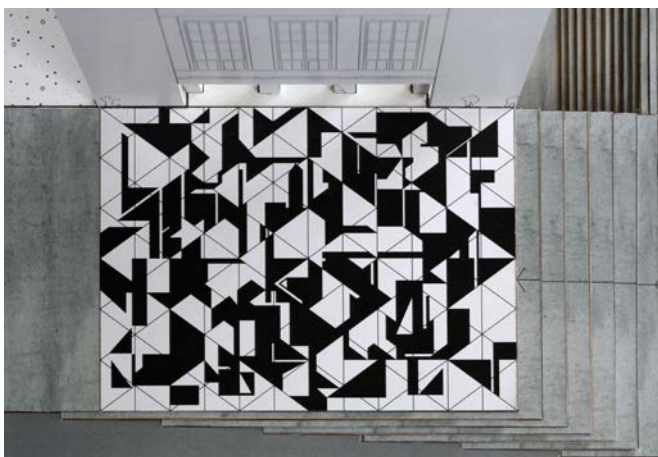
Model návrhu realizace vyroben v AP Atelieru Josefa Pleskota v Praze 2014